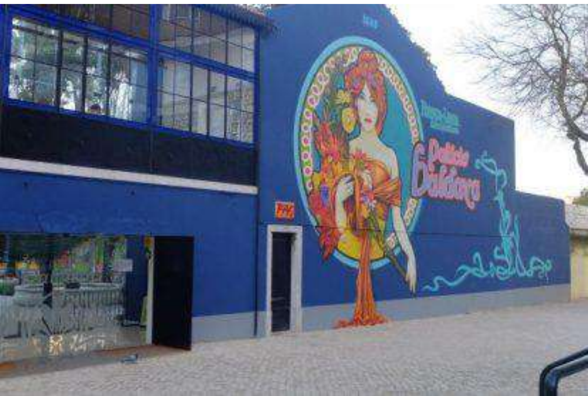
Palácio Baldaya - Benfica - depois