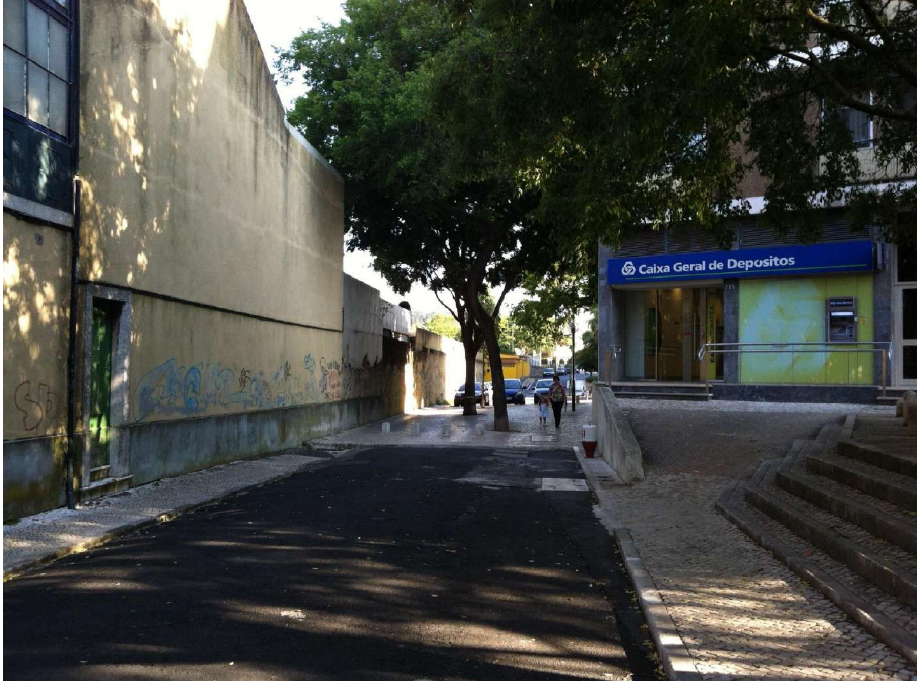
Palácio Baldaya - de Benfica - 2012